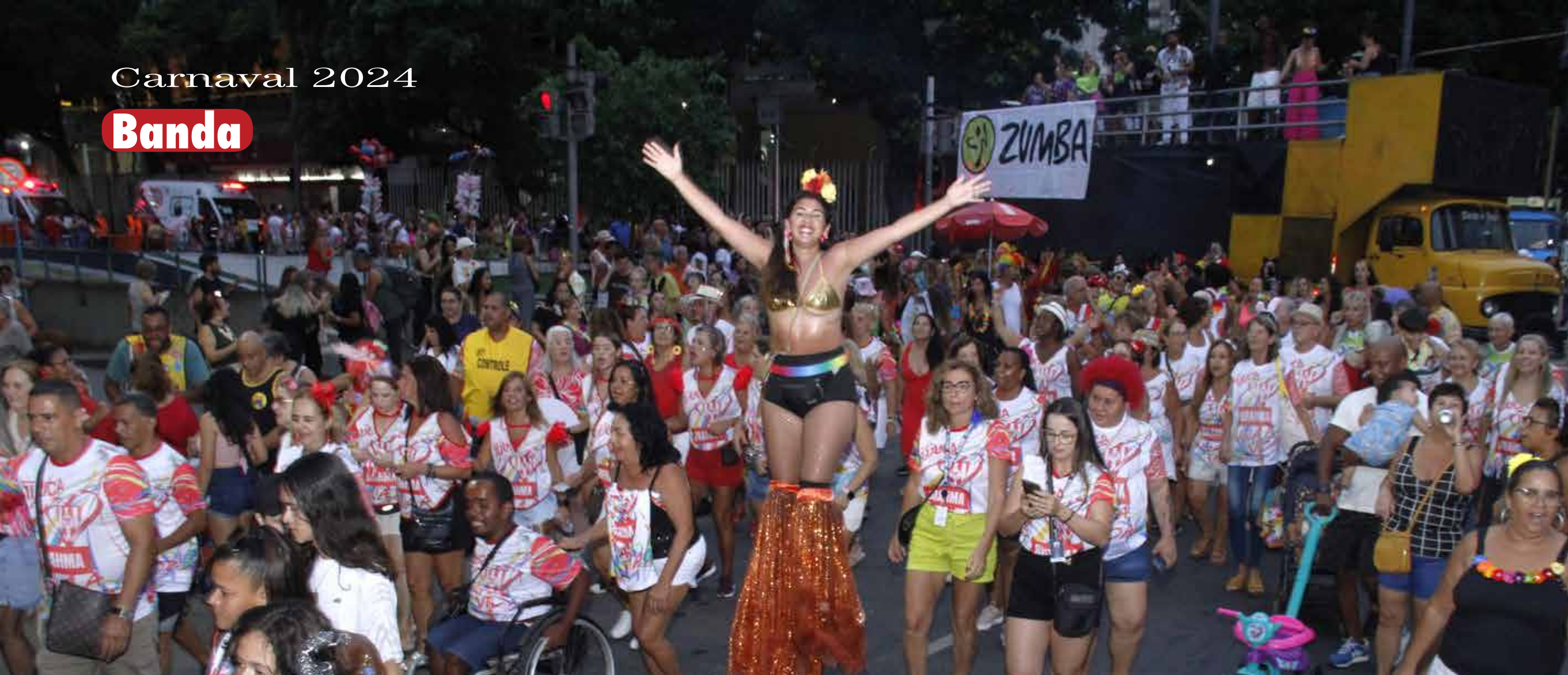
Um momento preenchido de alegria na Banda do TTC