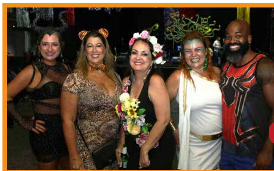
Baile à fantasia